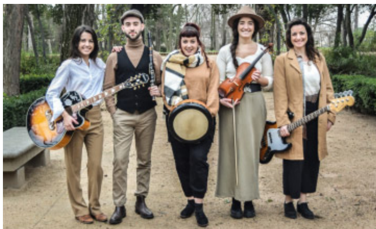
Irish Treble Band

festiva y cercana, habitual en salas y encuentros culturales vinculados a Brasil.