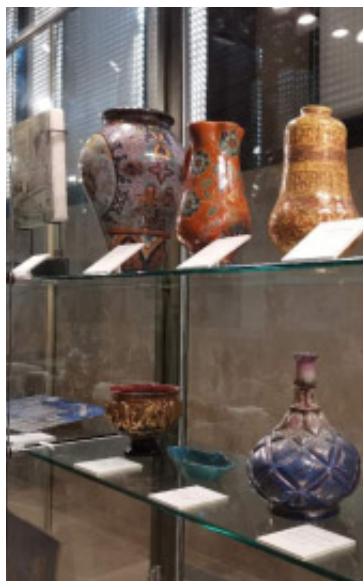
Museo de Segovia

lítica de la Cueva de la Vaquera, se explicarán y practicarán distintos métodos de cerámica a mano para realizar una pieza por cada participante. Necesario apuntarse vía telefónica en el Museo de Segovia para elaborar un mínimo de cinco participantes por grupo.