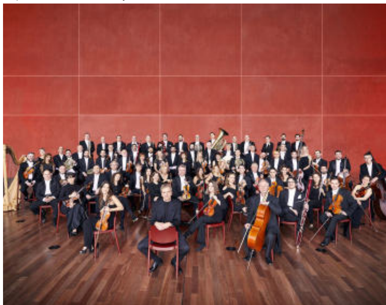
Orquesta Sinfónica de Castilla y León

S 21 - 11:00-14:00 h - Facebook, Instagram, X