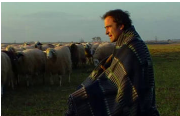
Adiós, hasta luego (1992-94), de Raúl Rodríguez