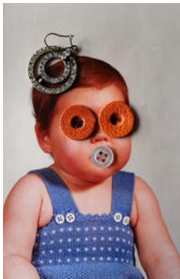
Taller didáctico Cara-Cosa