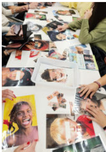
Encuentros Mirar, pensar, crear, compartir.