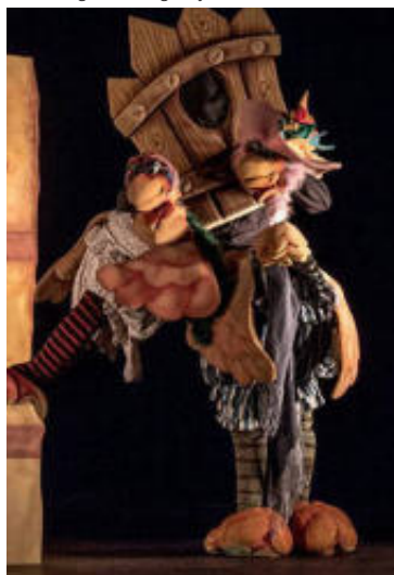
En un lugar de la granja. Arte Fusión Títeres

riencia dinámica e interactiva. Grupos a concertar.