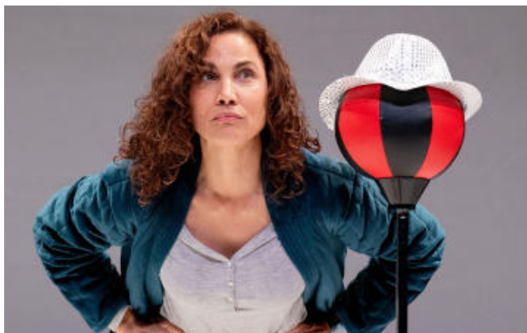
Una madre de película