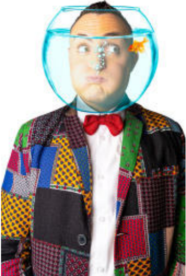
Disco fiesta. Kamaru Teatro